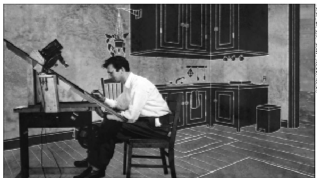
Image du film McLaren's Negatives .